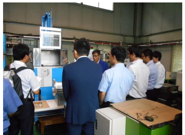
洗浄技術セミナー

洗浄技術や環境規制等の最新情報を中心とした「特別講演」、「JICCの活動紹介」や「優秀新製品賞の紹介と名刺交換」などを通じて、商社、販売店の皆様の業務に役立つ内容をいち早く伝えます。