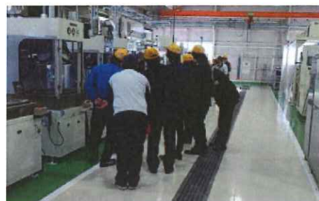
洗浄技術セミナー

洗浄技術や環境規制等の情報を中心とした「最新情報講演」、「JICCの活動紹介」や「優秀新製品賞の紹介と名刺交換」などを通じて、商社、販売店の皆様の業務に役立つ内容をいち早く伝えます。